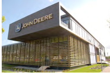
John Deere_Kaiserslautern 2010_03