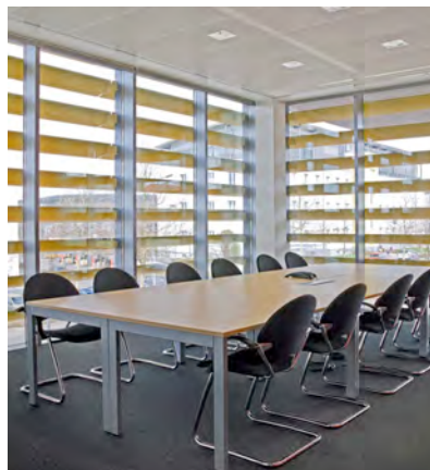
John Deere_Konferenz_ 2010_23