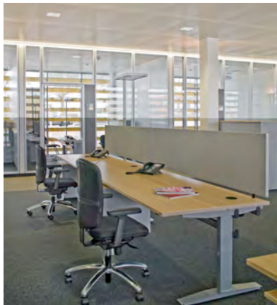
John Deere_Arbeitsplatz_ 2010_28