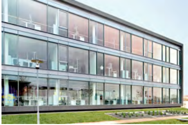
John Deere_Kaiserslautern 2010_02